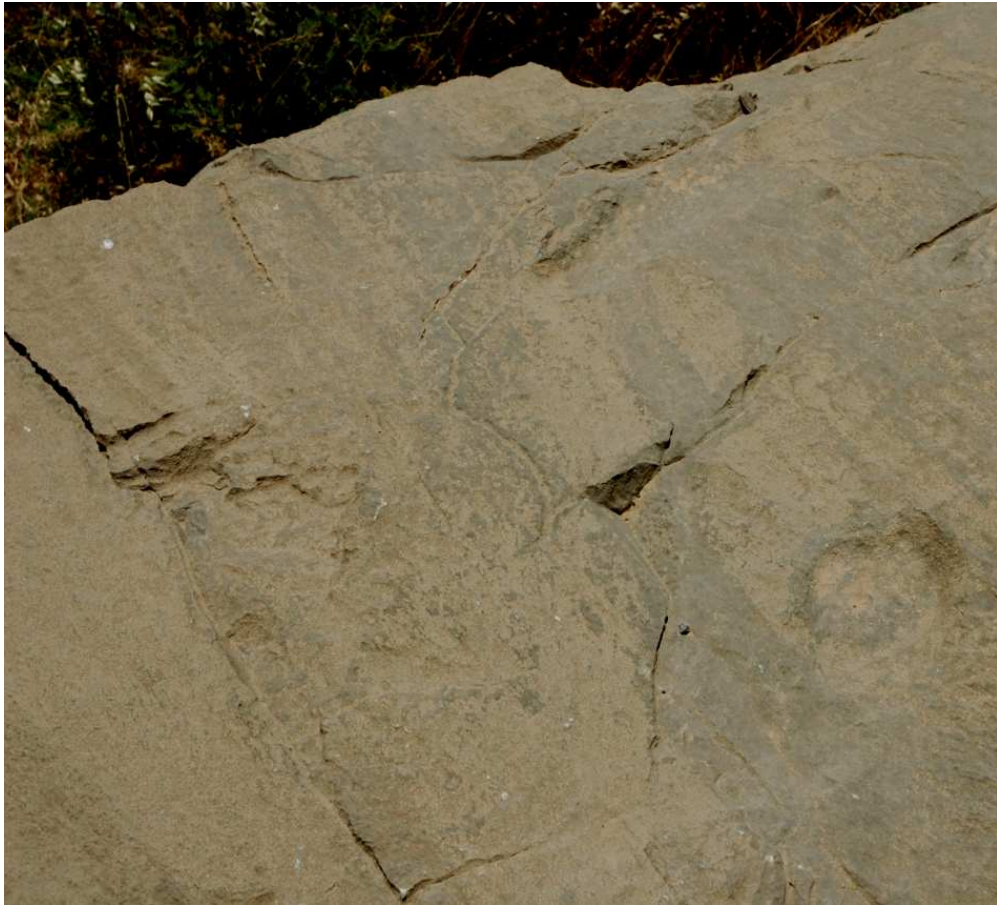
زور شتی دیکه‌ی فله‌کی و ناینی و لهوانه‌شه ئه‌فسانه‌یی لهم روانگه (مرید)ه دا هه‌یه.